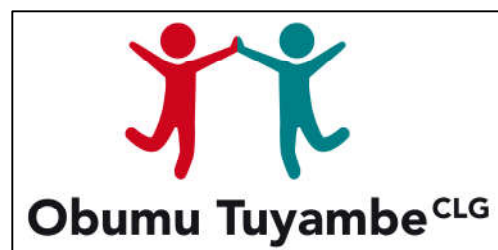
Logo der Organisation